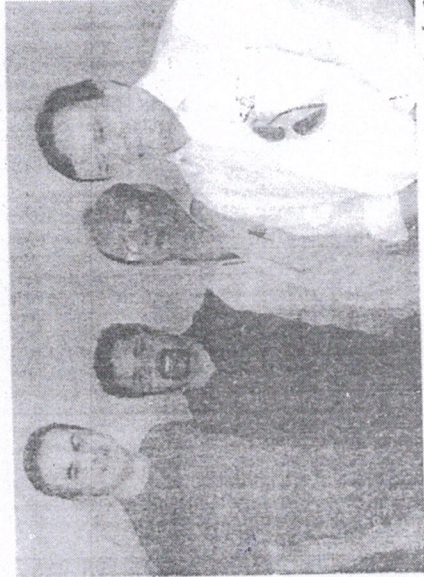
QUATRO NOMES. Um grupo de bons nomes. Quem são eles?

Volta. O São Paulo oficializou a volta do zagueiro Miranda, de 36 anos, que retorna ao clube após uma década. Tricampeão brasileiro com a equipe nas temporadas de 2006, 2007 e 2008, o atleta assinou com o tricolor paulista por um ano e oito meses, se tornando assim mais uma opção para Hernán Crespo no setor defensivo.